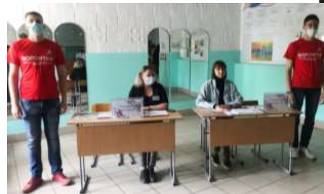
«День карьеры» с ЦЗН г. Бийска

ЦЗН УСЗН по городу Бийску, Бийскому и Солтонскому району