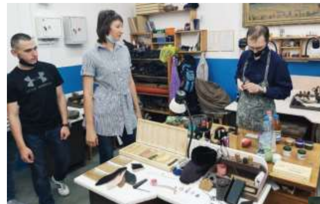
Экскурсия в ЦРС ВОС

Бийский филиал им. М.Н. Наумова ЧОУ ДПО «Центр реабилитации слепых Общероссийской общественной организации инвалидов»